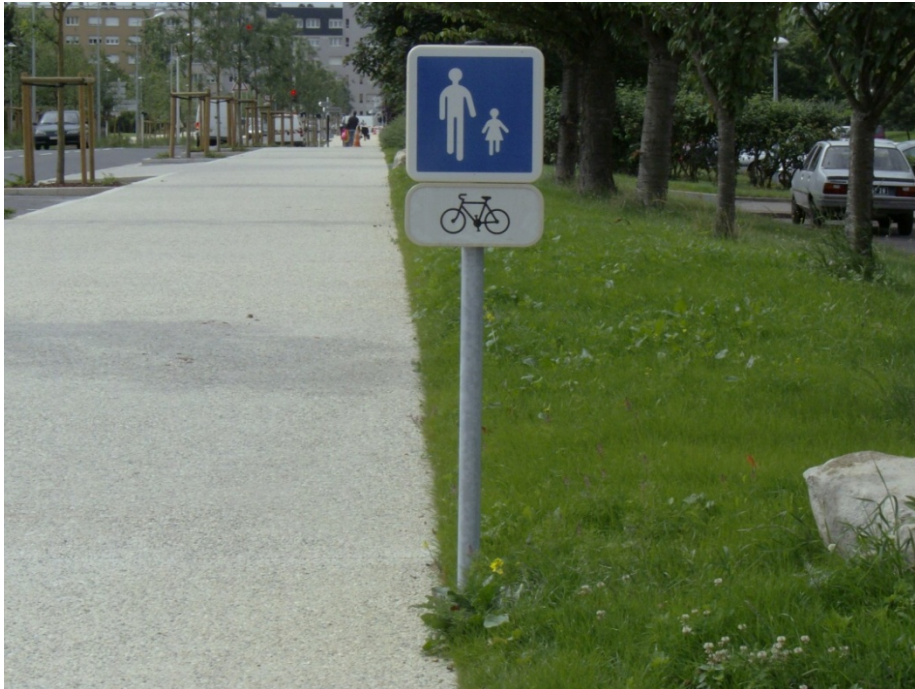
Des trottoirs mixtes « piétons-cyclistes »