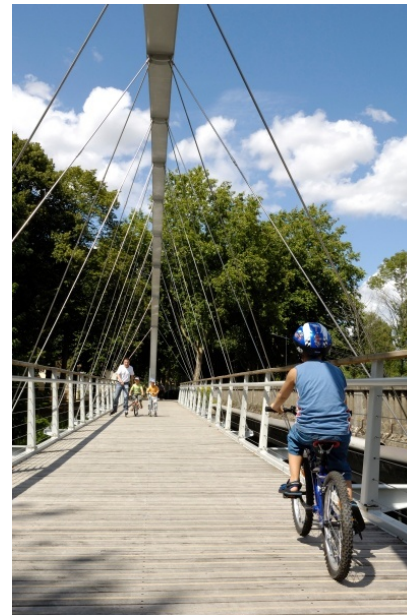
Un plan vert