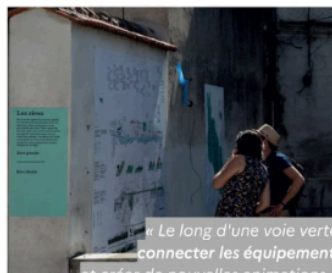
Boisset-lès-Montrond (Loire, 1 200 habitants)

« Le long d'une voie verte, connecter les équipements et créer de nouvelles animations. »