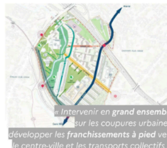
Savigny-sur-Orge | Citallios (Essonne, 37 000 habitants)

« Intervenir en grand ensemble sur les coupures urbaines, développer les franchissements à pied vers le centre-ville et les transports collectifs ».