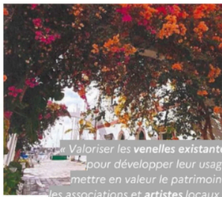
Le Vauclin (Martinique, 9 000 habitants)

« Valoriser les venelles existantes pour développer leur usage, mettre en valeur le patrimoine et les associations et artistes locaux ».