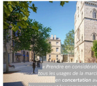
Cahors (Lot, 20 000 habitants)

« Prendre en considération tous les usages de la marche, en concertation avec les usagers et les commerçants ».