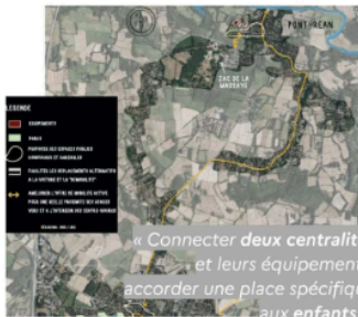
Guichen Pont-Réan (Ille-et-Vilaine, 9 160 habitants)

« Connecter deux centralités et leurs équipements, accorder une place spécifique aux enfants ».