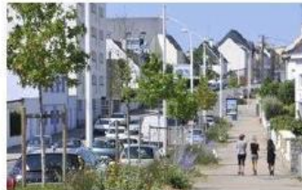
Boulevard Léon Blum

Modes à la fois "doux" pour la planète et "actifs" dans un contexte où la sédentarité constitue un enjeu de santé public majeur, ils sont le socle d'une mobilité durable. Sujet concernant tous les Lorientais, la Ville a souhaité mettre en place un large processus de concertation, dont émane notamment le présent questionnaire.