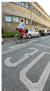
Lorient entend doubler son peloton de cyclistes réguliers en dix ans.

Le double sens cyclable - sur le modèle de la rue de Lamor (le cycliste circule en sens inverse des véhicules), sera développé dans une centaine de rues, tout comme les zones de rencontre (les piétons sont prioritaires sur les voitures)