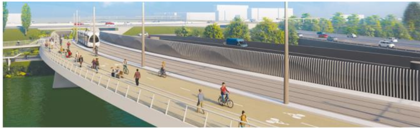
VL1, VL5 et VL9 le long de T9 – Saint Jean Villeurbanne