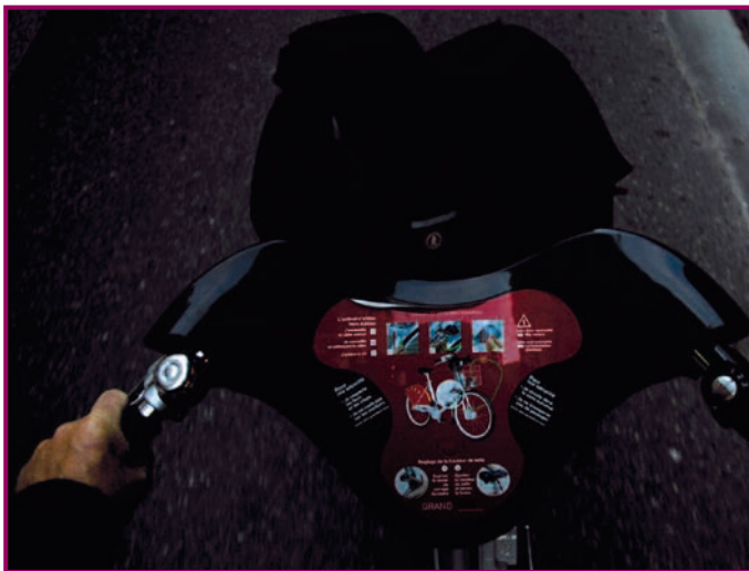
Ici en Vélov'. À quand le GPS intégré?

aura 4 000 vélos en libre-service et 340 stations, dont 6 nouvelles seront implantées à Vénissieux, Caluire-et-Cuire, Bron et Vaulx-en-Velin. « Ce qui me frappe, note Thérèse Rabatel, c'est la mixité sociale et générationnelle que l'on observe chez les cyclistes. Il y a une réelle convivialité et beaucoup d'entraide autour de Velo'V. Le vélo est un mode que l'on peut pratiquer ensemble. C'est un moyen de se resynchroniser, de vivre à nouveau ensemble le temps d'un trajet. ». Elle observe aussi que ce mode de locomotion apaise la ville et la sécurise la nuit. « Plus il y a de monde dans les rues, plus les gens sont sécurisés. De plus, le vélo permet d'apprécier le plan lumières destiné à mettre en valeur les bâtiments, les rues et les ponts de Lyon. »