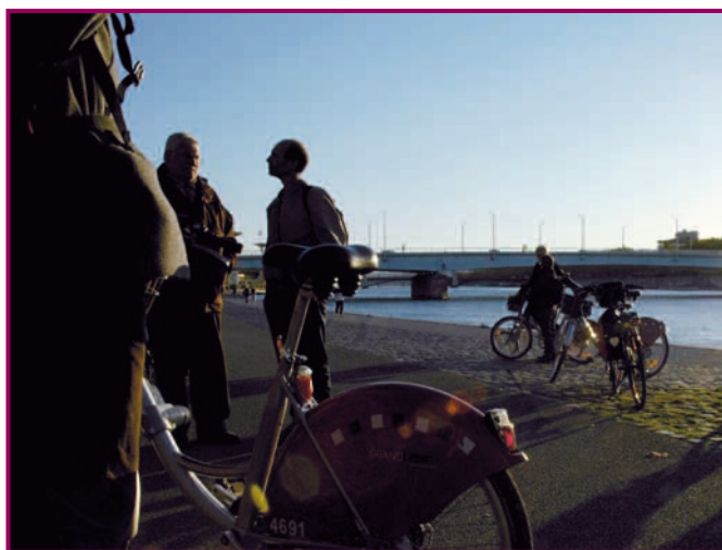
A Lyon, sur les berges aménagées de la Saône