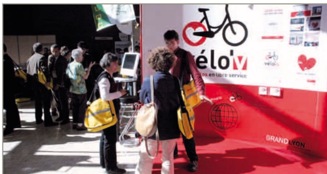
Ouverture de l'expo, premiers contacts