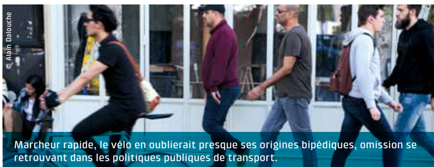
Marcheur rapide, le vélo en oublierait presque ses origines bipédiques, omission se retrouvant dans les politiques publiques de transport.

De forts enjeux sociaux et économiques reposent pourtant sur une ville « marchable », notamment la