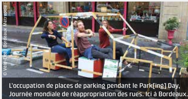
L'occupation de places de parking pendant le Park[ing] Day, Journée mondiale de réappropriation des rues. Ici à Bordeaux.

revisiter l'espace urbain à l'occasion de la Journée mondiale de réappropriation des rues, Park[ing] Day, devenue un rituel d'appropriation de places de parking. ■