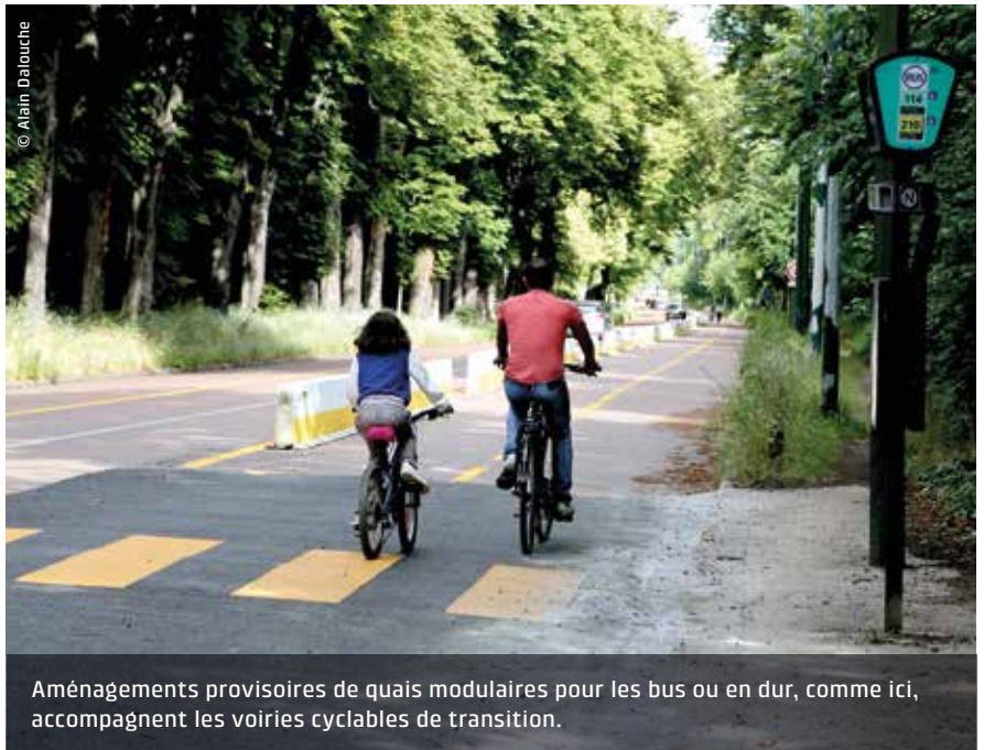
Aménagements provisoires de quais modulaires pour les bus ou en dur, comme ici, accompagnent les voiries cyclables de transition.

d'euros). Par ailleurs, un appel à projets du fonds mobilité active lancé courant juin permet d'accompagner les collectivités pour transformer le provisoire en définitif.