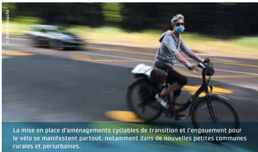
La mise en place d'aménagements cyclables de transition et l'engouement pour le vélo se manifestent partout, notamment dans de nouvelles petites communes rurales et périurbaines.

lire page 13), la ministre Élisabeth Borne annonçait le Coup de pouce vélo ! »