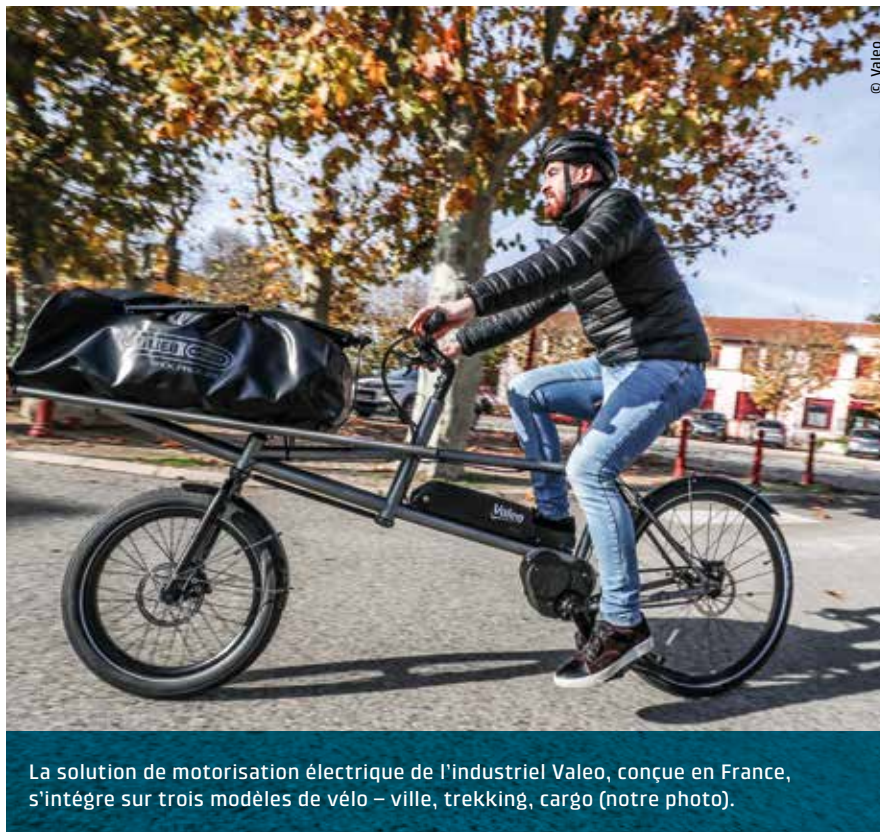
La solution de motorisation électrique de l'industriel Valeo, conçue en France, s'intègre sur trois modèles de vélo – ville, trekking, cargo (notre photo).