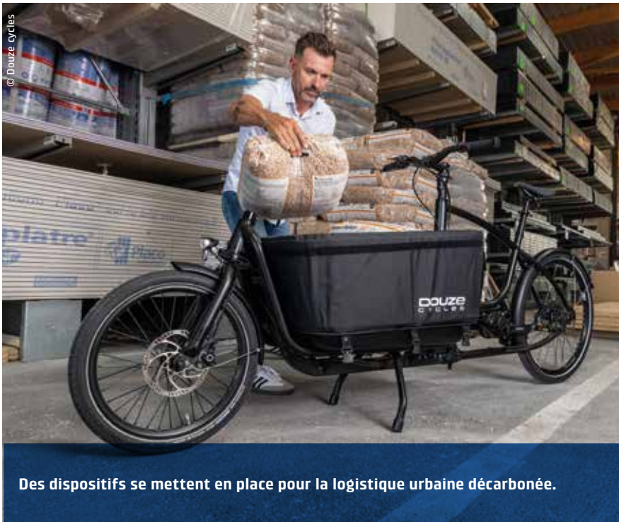
Des dispositifs se mettent en place pour la logistique urbaine décarbonée.