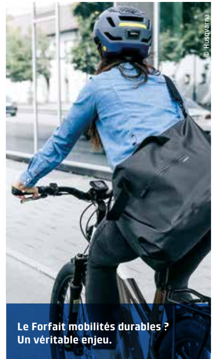
Le Forfait mobilités durables ? Un véritable enjeu.

et l'identification des cycles et des mobilités actives) comme délégataire de l'identification des cycles (lire page 16) et le schéma national des véloroutes ont été ordonnés. « Très rapidement vont être publiés les décrets sur le stationnement des vélos dans les gares et l'emport des vélos dans les cars. Il restera encore à paraître, en février ou mars, un décret sur la place des vélos dans les constructions neuves et existantes », avance le coordonnateur interministériel pour le vélo, qui souligne l'importance de ce sujet. « Cette prise en compte de l'intermodalité transports en commun + vélo constitue un véritable enjeu. On sait que l'on va progresser sur ce point grâce à la LOM, ses décrets d'application, mais aussi au plan de relance dont on espère qu'une partie des sommes permettra d'installer du stationnement sécurisé dans les gares. »