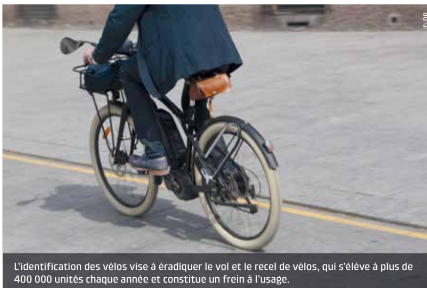
L'identification des vélos vise à éradiquer le vol et le recel de vélos, qui s'élève à plus de 400 000 unités chaque année et constitue un frein à l'usage.

Six opérateurs attendent l'agrément du ministère de l'Intérieur pour pouvoir reverser les identifiants issus de leurs marquages dans un fichier central. En plus de quatre opérateurs de marquage (Auvray security, Bicycode, Paravol, Recobike) se trouvent deux fabricants (assembleurs) de vélos, les plus