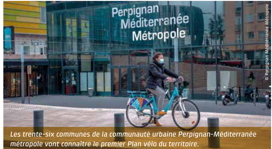
Les trente-six communes de la communauté urbaine Perpignan-Méditerranée métropole vont connaître le premier Plan vélo du territoire.

« En 15 minutes, du centre du Soler vous pourrez rejoindre Perpignan sur des pistes cyclables sécurisées »